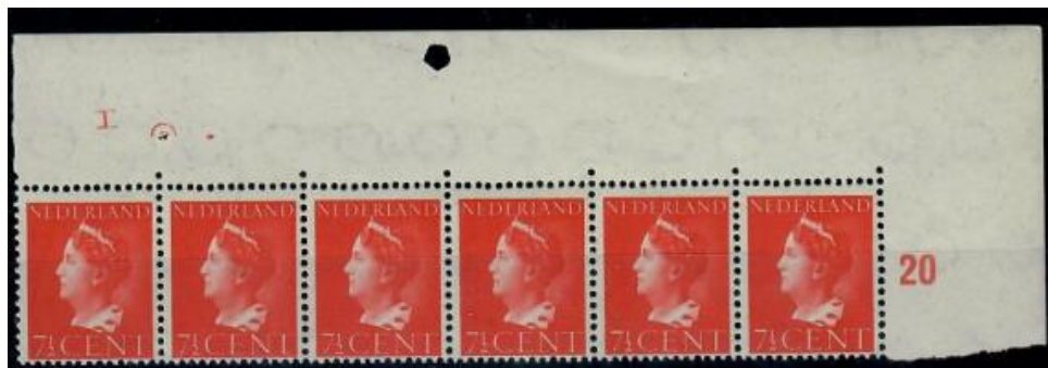
Figuur 1 Konijnenburg 6 x 7½ cent met velrand, etsingnummer I

De 1 gulden 15 – 2 -- 1946, de 2½, 5 en 10 gulden 18 – 5 -- 1946 als vroegst bekende data.