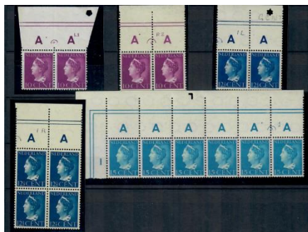
Figuur 4 Artikel 1 Konijnenburg zegels met velrand, met randlijnen en oplage letters

Voorbeelden van de vroege drukken met oplageletters. (zie figuur 5)