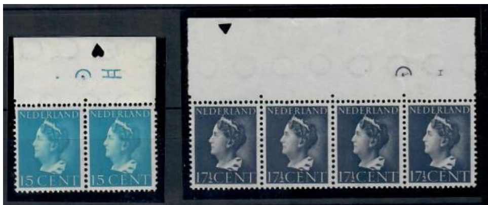
Figuur 5 Naoorlogse drukken, velranden met etsingnummers in Romeinse cijfers

Nog wat voorbeelden van de naoorlogse drukken