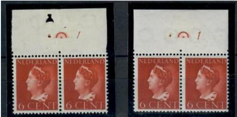
Figuur 2 Vergeten L en R bij etsingnummer bij naoorlogse Konijnenburg 6 cent

Bij de 6 cent is men bij de eerste drukplaat de L en R van het etsingnummer vergeten, ook zonder deze is er verschil te zien tussen de nummers, 1A eb 1B. (zie figuur 3)