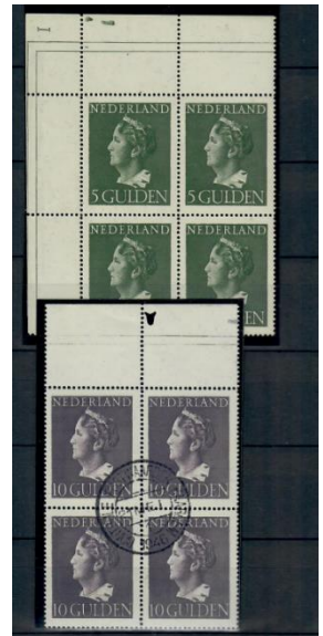
Figuur 3 Konijnenburg gulden waarden, velrand met krabbel van drukker

Bij de 1, 2½ en 5 gulden komt nog een zogenaamde krabbel voor, dat is een teken van een van de drukkers die een merkteken op een drukplaat gemaakt heeft. Deze staan in de linkerbovenhoek van het vel en is een liggende Romeinse I, boven de randlijnen. Specialisten kunnen voor- en naoorlogse drukken onderscheiden aan het papier, daar staat in de NVPH een stuk over.